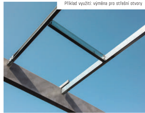
Příklad využití: výměna pro střešní otvory