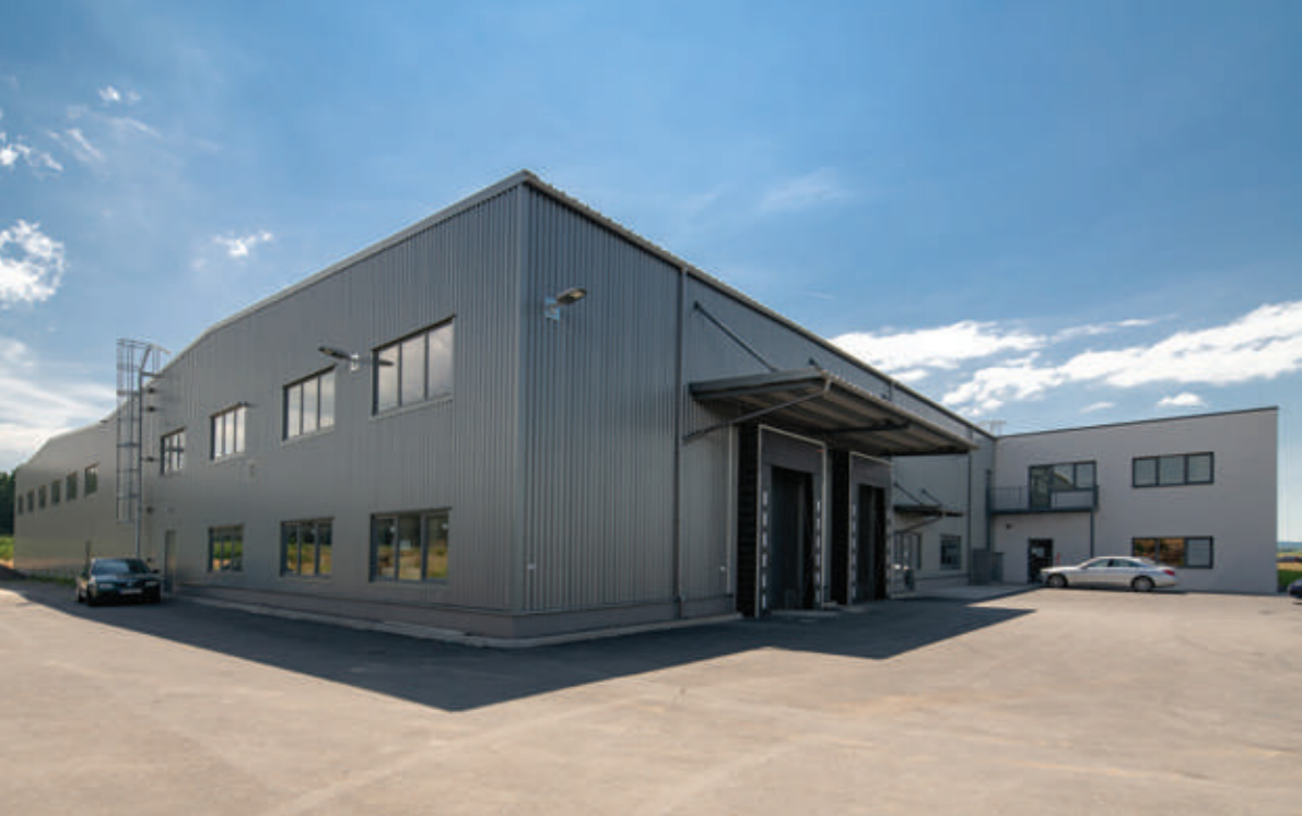
CZ0928 BOHEMIATEX (skladová a výrobní hala)