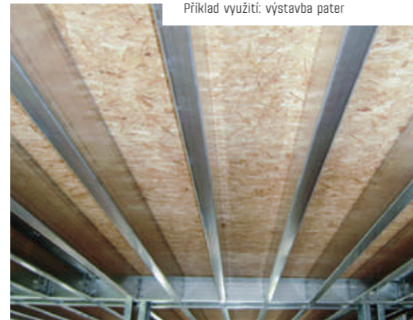
Příklad využití: výstavba pater