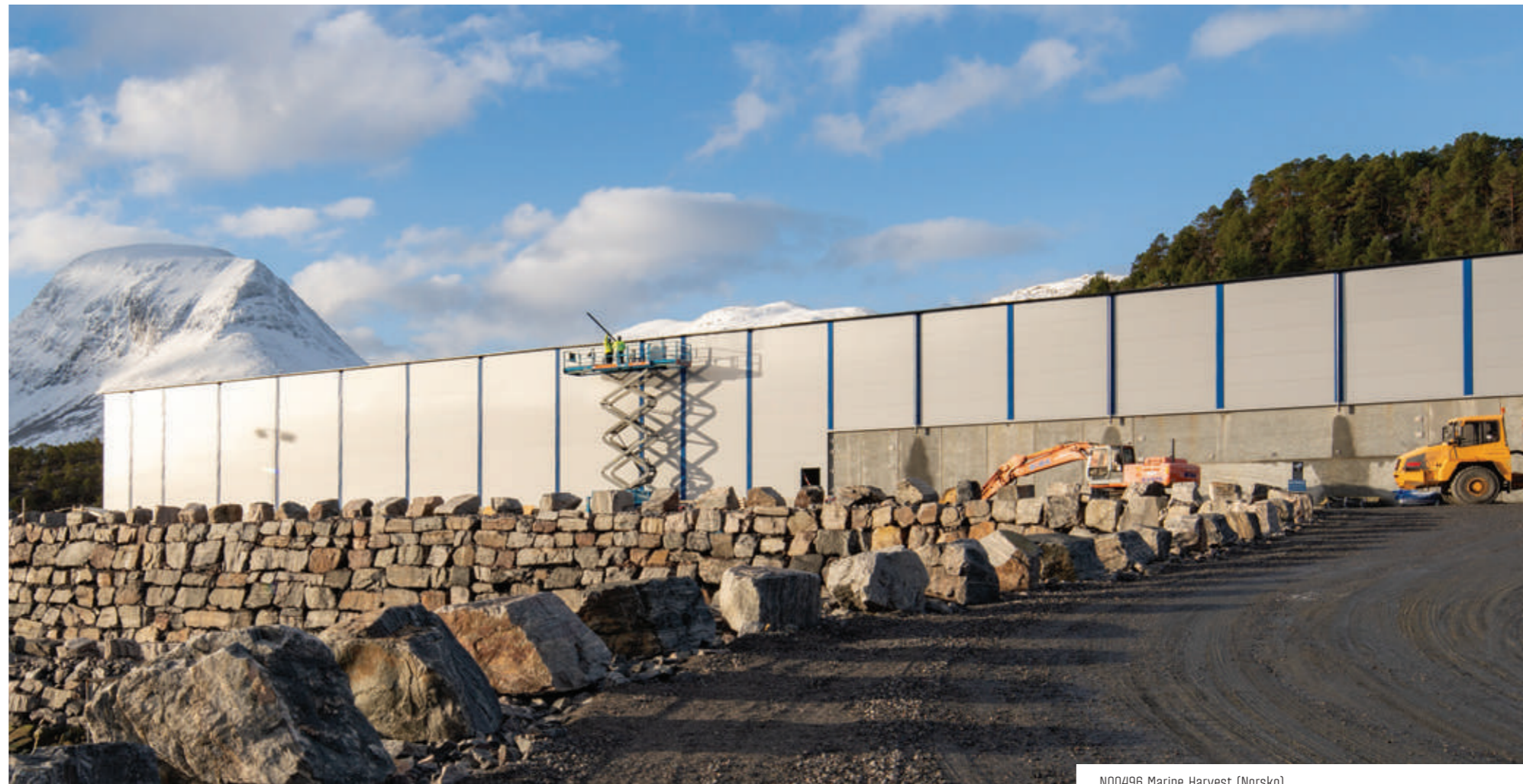
N00496 Marine Harvest (Norsko)

Dobrá stavební legislativa ovlivňuje nejen kvalitu a bezpečnost staveb, ale má zásadní vliv na zdraví stavebního sektoru a hospodářství jako celku. Na komplikovanost povoloovacího procesu přitom nedoplácí pouze investoři, ale úplně všichni. Důsledky jsou viditelné – vážně budování potřebné infrastruktury, chybí nové prostory a byty, roste jejich cena a úměrně tomu i nájemné. Nezanedbatelný je také vliv stavebnictví na hospodaření státu a zaměstnanost. Podle nedávné studie představuje stavebnictví v ekonomikách OECD v průměru 6,5 % HDP. Stavebnictví je současně největším průmyslovým zaměstnavatelem v Evropě, na zaměstnanosti se podílí cca 7 %.