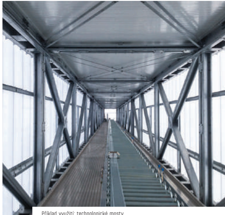
Příklad využití: technologické mosty