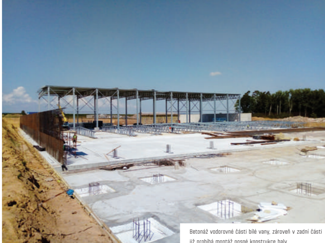
Betonáz vodorovné části bílé vany, zároveň v zadní části již probíhá montáž nosné konstrukce haly.