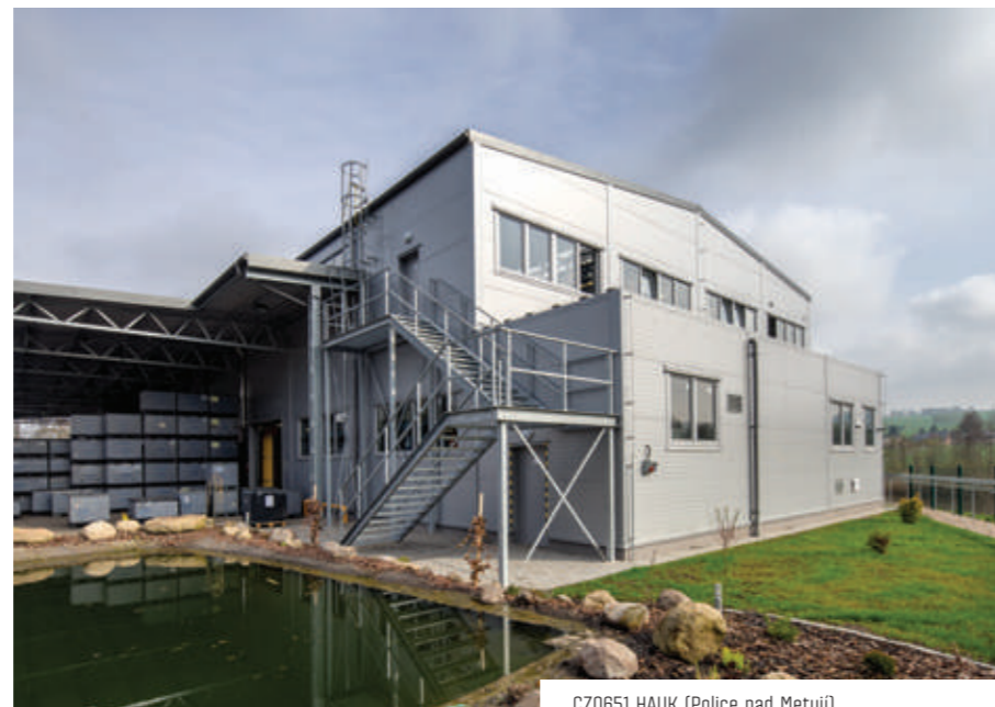
CZ0651 HAUK (Police nad Metují)