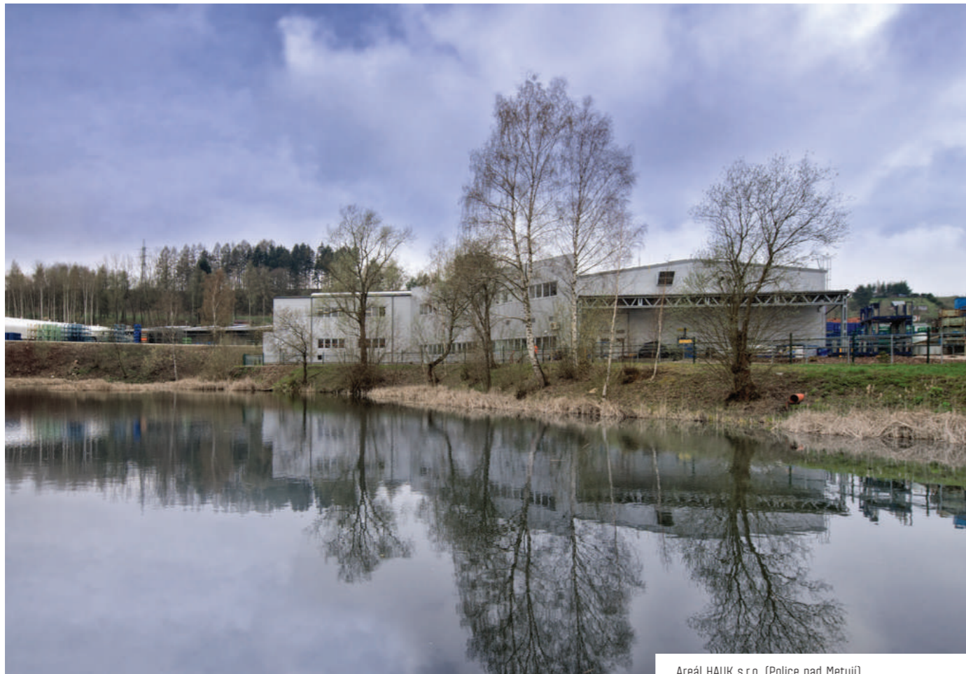
Areál HAUK s.r.o. (Police nad Metují)