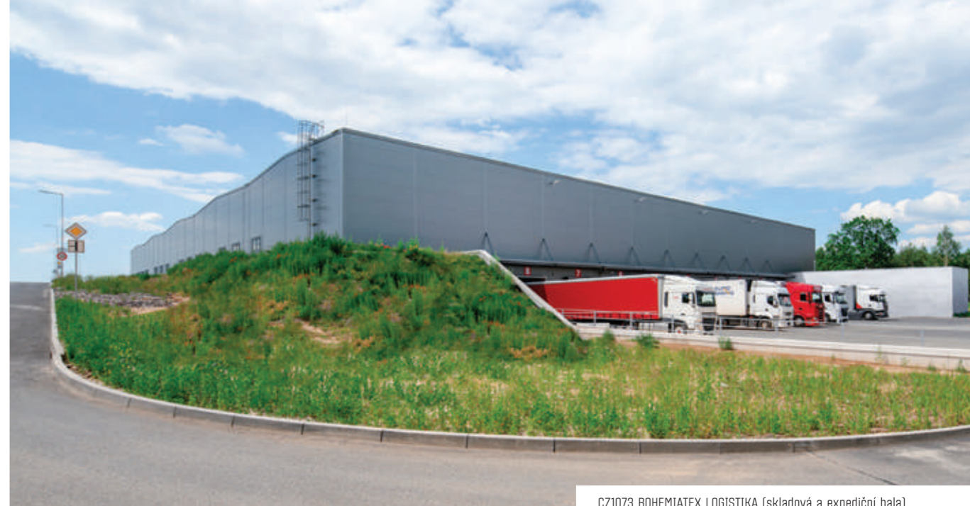
CZ1073 BOHEMIATEX LOGISTIKA (skladová a expediční hala)