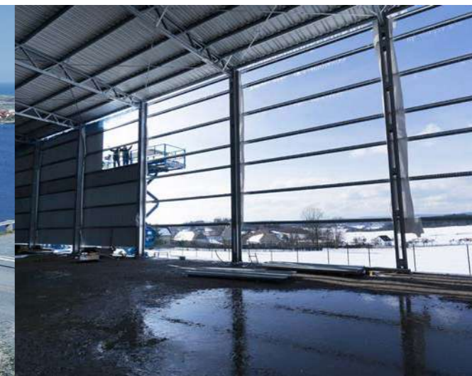
Doprava a montáž pomocí vlastních kapacit